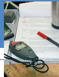
Strumenti del mestiere

per portare le relazioni nel digitale e dal digitale alla vita quotidiana. Infine, il settimo, #partecipare alla produzione culturale del nostro tempo, anche tramite dirette video o contenuti. Questi sono solo alcuni spunti. La cosa che li accomuna è la presenza costante di quella che possiamo chiamare una "call to action". I giovani sono protesi al "fare" e una delle caratteristiche del digitale è la partecipazione: ricordiamoci di sfruttarla bene.