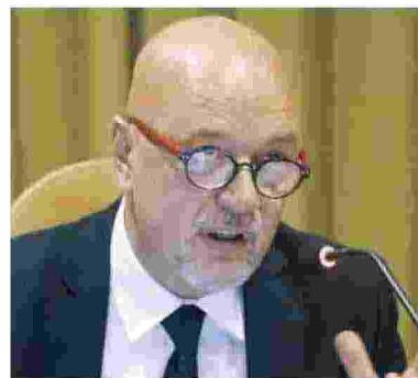
Una giornalista durante un reportage in Africa. Sopra, Pier Cesare Rivoltella / Ansa